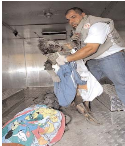
Imagen de niño libanés carbonizado por las bombas lanzadas por Israel

Asimismo, la cada vez más repelente derecha española abusa también de una falacia idéntica a la esgrimida por Batasuna cuando acusaba de "antivascos" a los que condenaban las amenazas y los